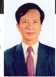
Vo Hong Phuc Ministro de Planeamiento e Inversión

En nombre del Gobierno de Viet Nam como país anfitrión, nos complace darles la bienvenida a Viet Nam para la celebración de la tercera Mesa redonda internacional sobre gestión orientada a los resultados en términos de desarrollo.