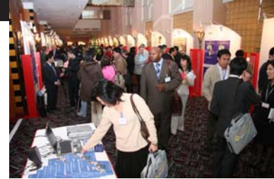
Participantes en la Mesa redonda visitan la Feria de Resultados